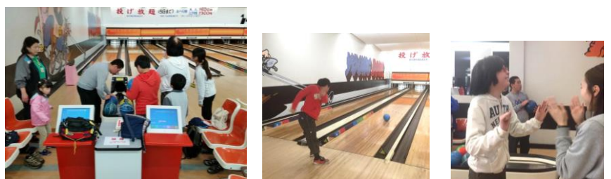
ボーリングでは、ピンが倒れると大はしゃぎ♪