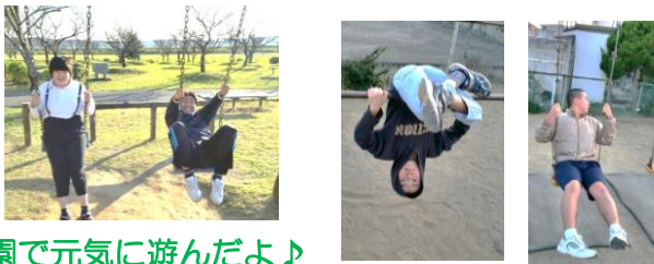
公園で元気に遊んだよ♪