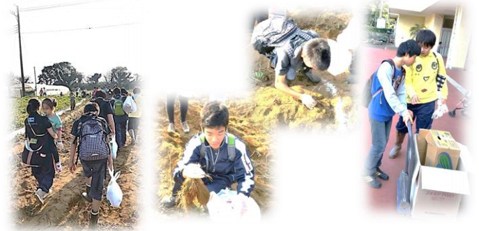
草ぶえの丘で、たくさんお芋を掘ってきたよ！