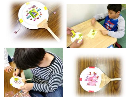
デンデン太鼓を作ったよ♪