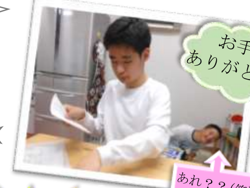
お手伝い ありがとう！