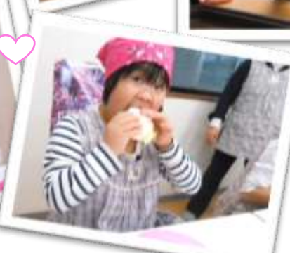
ミニハンバーガー おいしいね☺