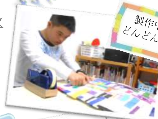
製作中... どんどん大き