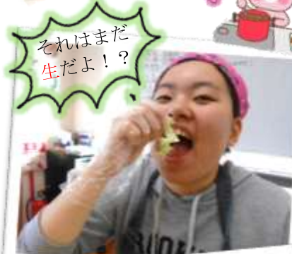
それはまだ生だよ！