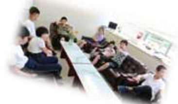
とてもお似合いですね！