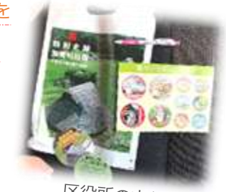
区役所の方から お茶やシール、コースター、 ボールペンのお土産を いただきました。