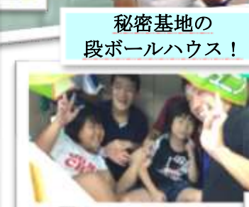
秘密基地の 段ボールハウス！