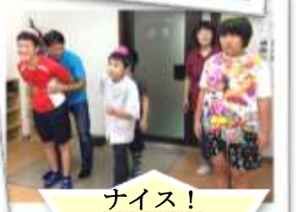
ナイス！ ハイタッチ！！